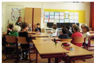
オランダ発祥 ピースフルスクール プログラムを導入

「みんなの未来をつくる保育園」では、オランダ発祥の「ピースフルスクールプログラム」を認可保育園で初めて導入し、保育理念「みんなの未来をつくる」ことに自ら参加し貢献しそして楽しむ心を育みます。」の下、シチズンシップ保育に挑戦します。さらに、「こどもミーティング」や「感情カード」を通して、「好奇心」「冒険心」のある自分らしい子ども・他者を思いやることのできる子ども・自分で考え、表現し、そして行動できる子どもを育てます。