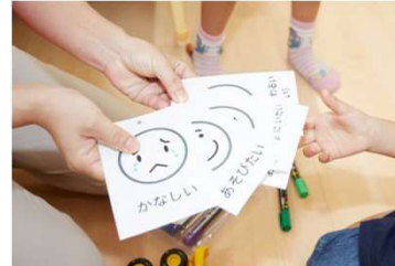
一人ひとりの「気持ち」を 尊重する感情カード