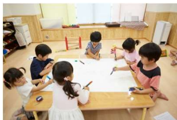
自分たちで「未来」を 決める子どもミーティング を毎日実施